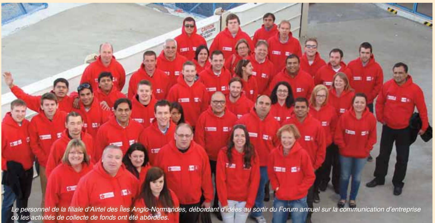
Le personnel de la filiale d'Airtel des Îles Anglo-Normandes, débordant d'idées au sortir du Forum annuel sur la communication d'entreprise où les activités de collecte de fonds ont été abordées.

Le forum sur la communication en entreprise de cette année a constitué une bonne occasion de sensibiliser les employés sur la mission de cette fondation et de réfléchir sur des activités de collecte de fonds possibles. ■