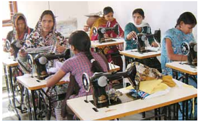
Les femmes du village de Geejgarh de Jaipur (Inde) en train de coudre des sacs en tissu pour les magasins Bharti Walmart.

Les déchets en provenance des lieux d'aisance et de la cantine sont traités dans la station d'épuration. L'eau propre est ensuite utilisée pour le jardinage et le nettoyage des locaux de l'usine.