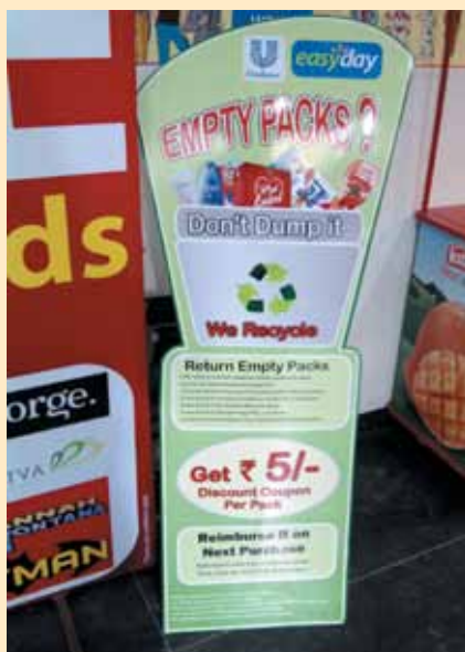
Campagne de recyclage des matières plastiques des magasins Bharti.

En perspective de la résolution du problème des toxines et des déchets électroniques, Airtel et Comviva s'engagent à confier à des compagnies certifiées la gestion de leurs déchets électroniques. Comviva a confié le traitement de ses déchets électroniques à Greenscape Eco Management. Quant à l'entreprise Airtel, elle veille à ce que la gestion de ses déchets électroniques, provenant du réseau et d'installations sur le terrain, soit conforme aux normes WEEE.