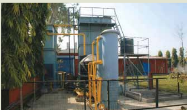
La station d'épuration de l'usine de Beetel à Ludhiana.

De même, dans son usine de Ludhiana, Beetel a installé un système de captage des eaux pluviales, une station d'épuration de 40 KL pour éliminer les rejets et un système d'éclairage naturel afin de réduire la dépendance à la lumière en plein jour.