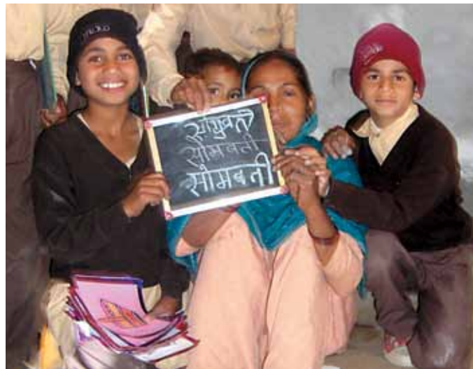
L'équipe des champions: les élèves en 5e année d'études de l'école Satya Bharti d'Adhon

Le programme est devenu populaire grâce à son efficacité. Aujourd'hui, près de 35 adultes ont appris à écrire leurs noms et 25 autres ont rejoint le programme. Cette prouesse ne justifie pas à elle seule la fougue avec laquelle la communauté d'Adhon relate les succès du programme. En effet, cette euphorie autour de la campagne d'alphabétisation découle également de la grande fierté ressentie quand le programme a reçu les