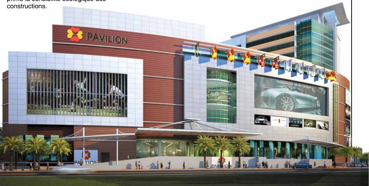
Le Pavilion Mall de Ludhiana au Pendjab en Inde, fait partie des projets de Bharti Realty. C'est le premier centre commercial du pays pré-certié « LEED Gold »