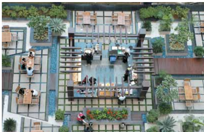
Le design intelligent du Airtel Campus de Gurgaon, Inde, garantit une utilisation optimale de la lumière naturelle.

Les principes écologiques sont de plus en plus assimilés au niveau des agences des entreprises du groupe. Les sociétés du groupe Bharti ont adopté une architecture, du matériel et des attitudes respectueux de l'environnement. La plupart des bureaux des sociétés du groupe utilisent principalement la lumière naturelle ; et configurent leurs imprimantes de manière à utiliser le recto et le verso de feuilles de papier afin d'en réduire la consommation.