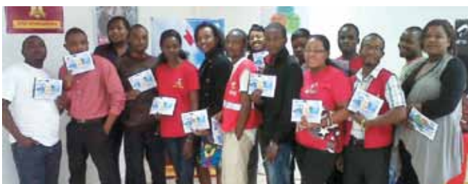
L'équipe d'Airtel Afrique à l'inauguration de l'Académie.

Axée sur les services clients de pointe, la formation offerte contribuera essentiellement à mettre à niveau les connaissances, compétences et rôles des responsables des services clients. Elle reposera sur une approche systématique et durable intégrant divers procédés, tels que l'apprentissage en ligne et la formation théorique et pratique. ■