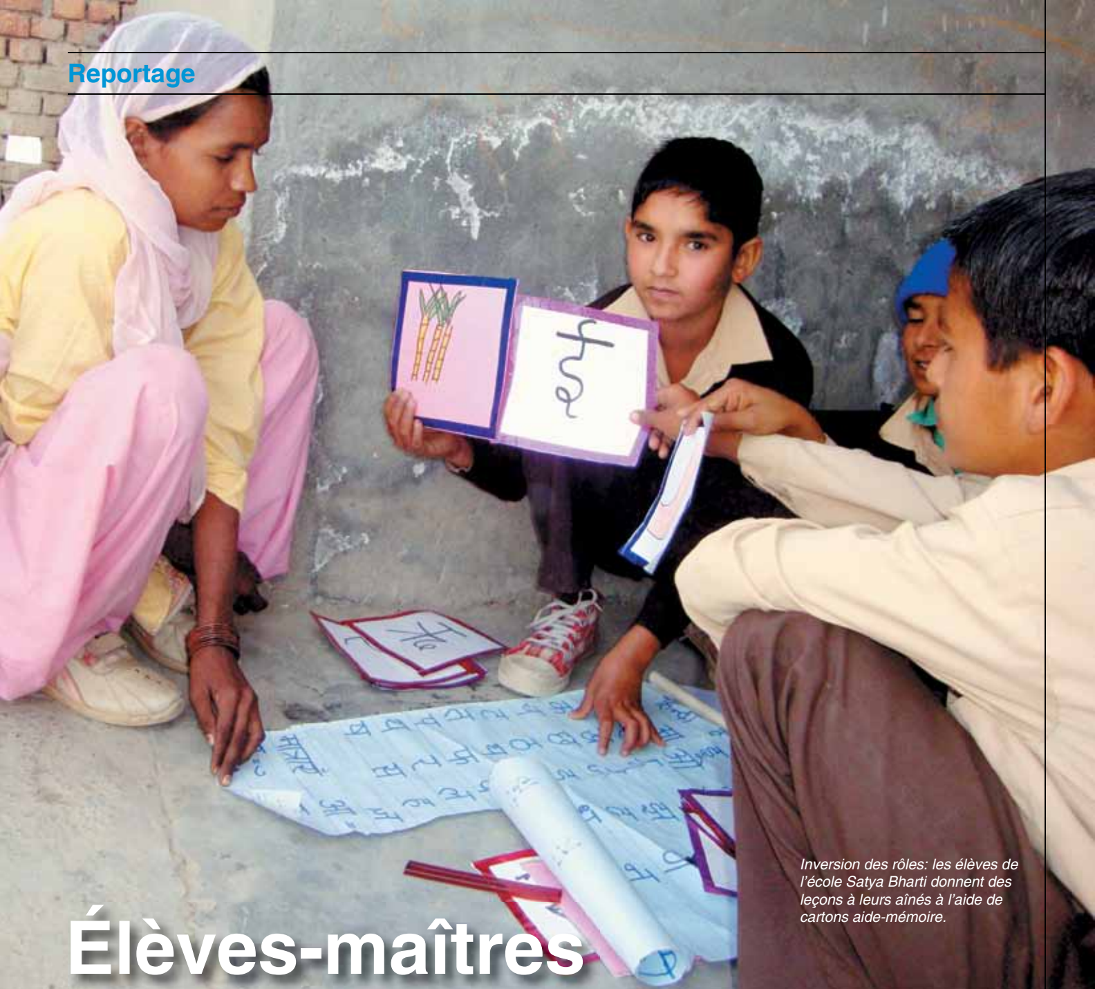
Inversion des rôles: les élèves de l'école Satya Bharti donnent des leçons à leurs aînés à l'aide de cartons aide-mémoire.