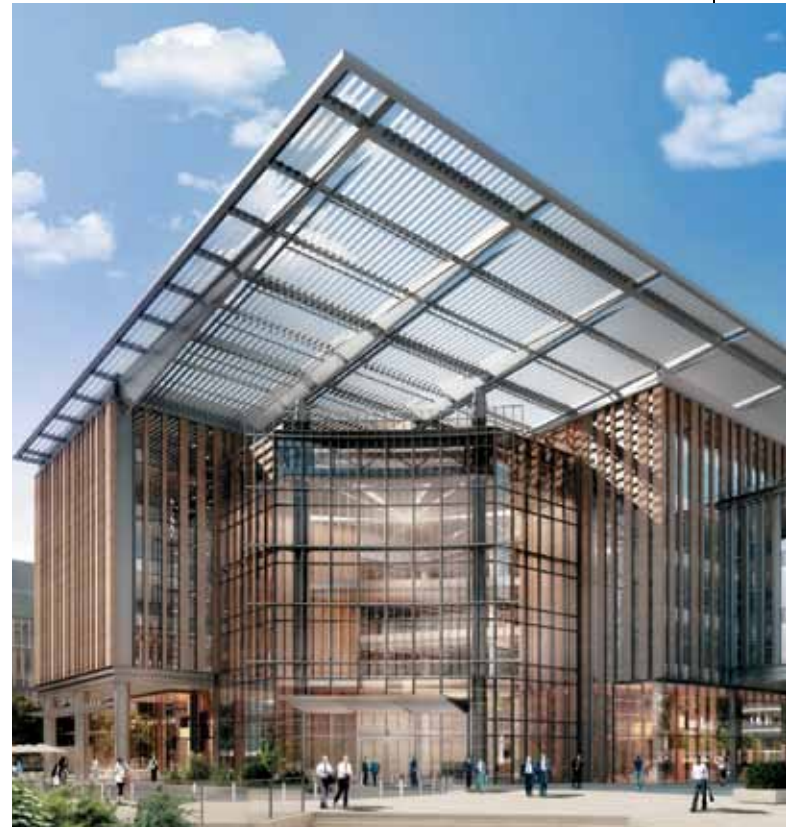
Le Worldmark un projet que Bharti Realty compte réaliser à l'Aerocity de New Delhi, est le premier centre commercial d'Inde pré-certié « LEED Platinum »

Bharti Realty vise également l'obtention de la certification LEED (Leadership in Energy & Environmental Design) pour tous ses futurs aménagements. La société a déjà commencé à œuvrer dans ce sens avec l'obtention de la pré-certification LEED pour deux de ses prochains projets. Les constructions certifiées LEED, avec leur conception durable, seront de 30 % à 40 % plus éco-énergétiques que les constructions conventionnelles. La certification LEED est un système de certification des constructions écologiques mondialement reconnu qui prime la sensibilité écologique des constructions.