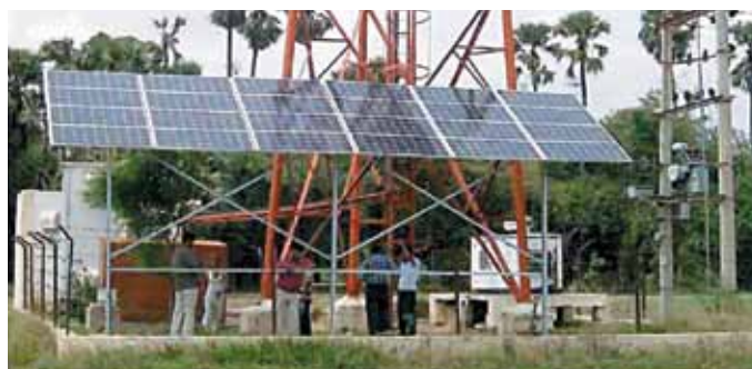
L'installation solaire de 6 mégawatts d'Infratel d'une station de base d'Airtel, l'une des plus grandes d'Inde.

Les systèmes de refroidissement par une source naturelle déployés dans 5200 sites permettent d'économiser 4,1 millions de litres de diesel par an.