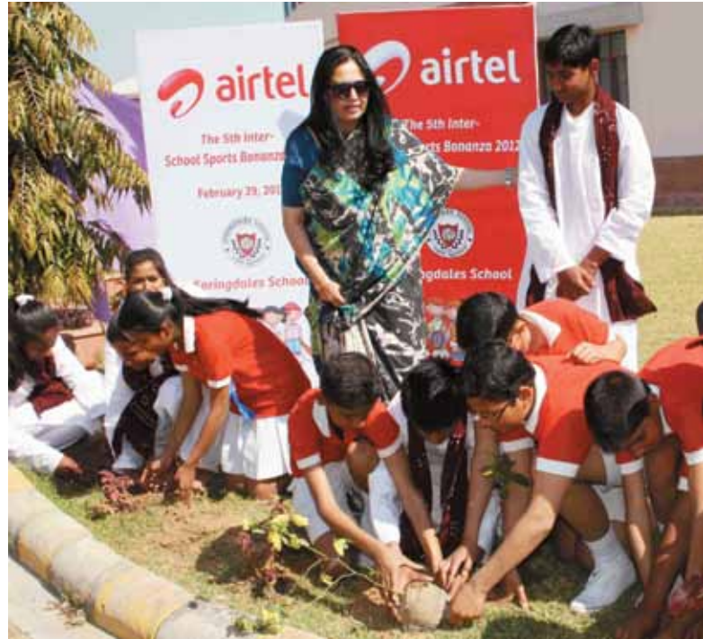
Campagne de plantation d'Airtel Rajasthan.

Les employés de Comviva plantent de jeunes arbres à l'occasion de la Journée mondiale de l'Environnement.